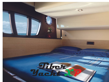
Tiber Yacht XP