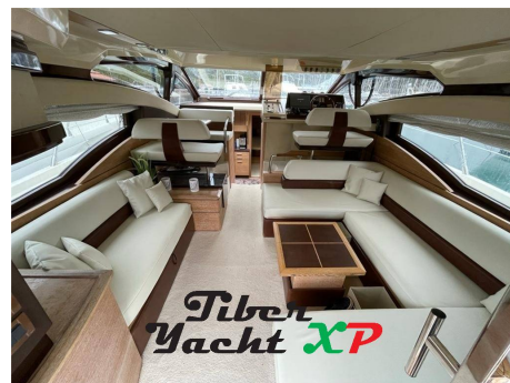
Tiber Yacht XP