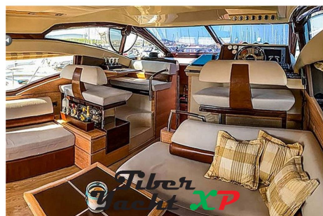
Tiber Yacht XP