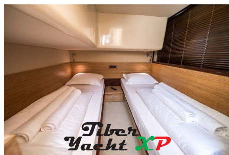
Tiber Yacht XP