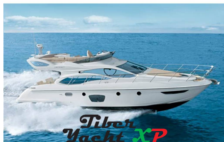
Tiber Yacht XP