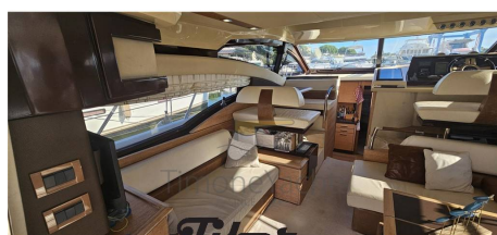
Tiber Yacht XP