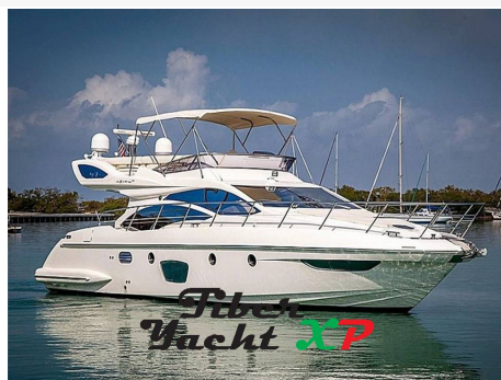
Tiber Yacht XP