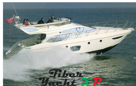
Tiber Yacht XP