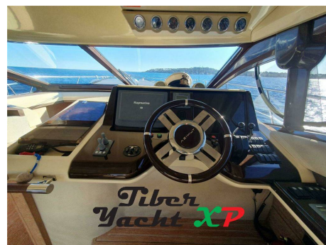
Tiber Yacht XP