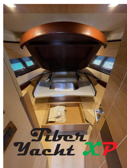
Tiber Yacht XP