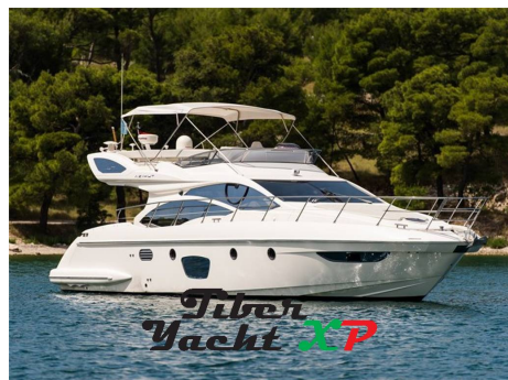
Tiber Yacht XP