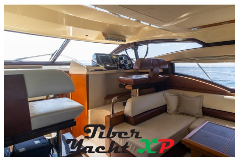
Tiber Yacht XP