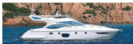
Tiber Yacht XP