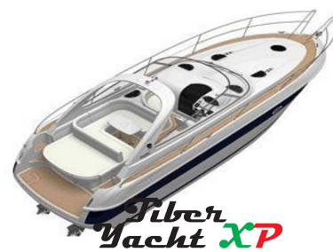
Tiber Yacht XP