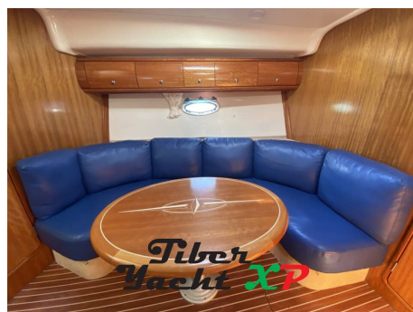
Tiber Yacht XP