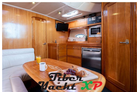
Tiber Yacht XP