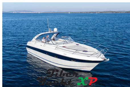
Tiber Yacht XP