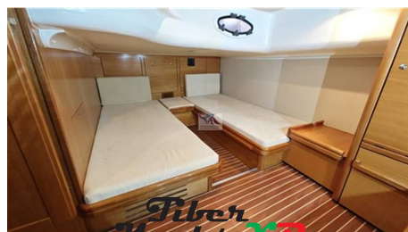
Tiber Yacht XP