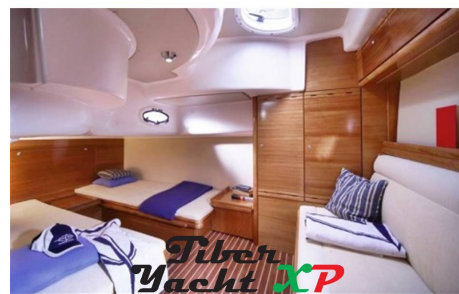
Tiber Yacht XP