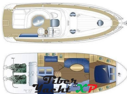
Tiber Yacht XP